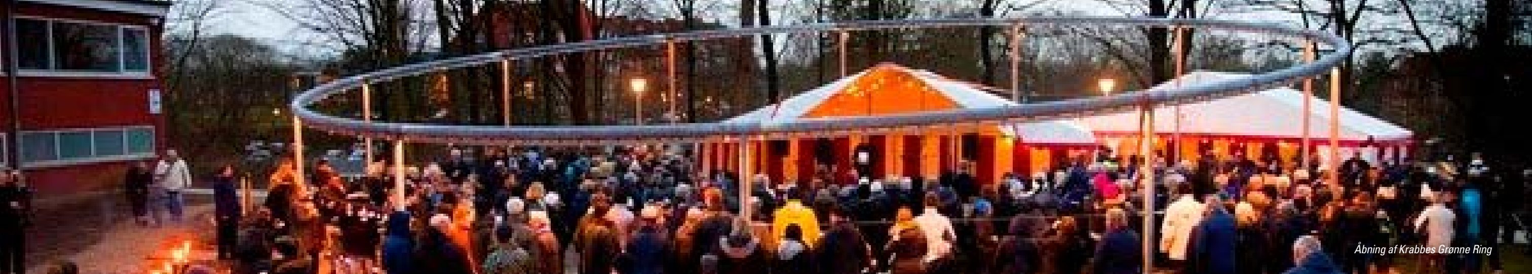
Åbning af Krabbes Grønne Ring