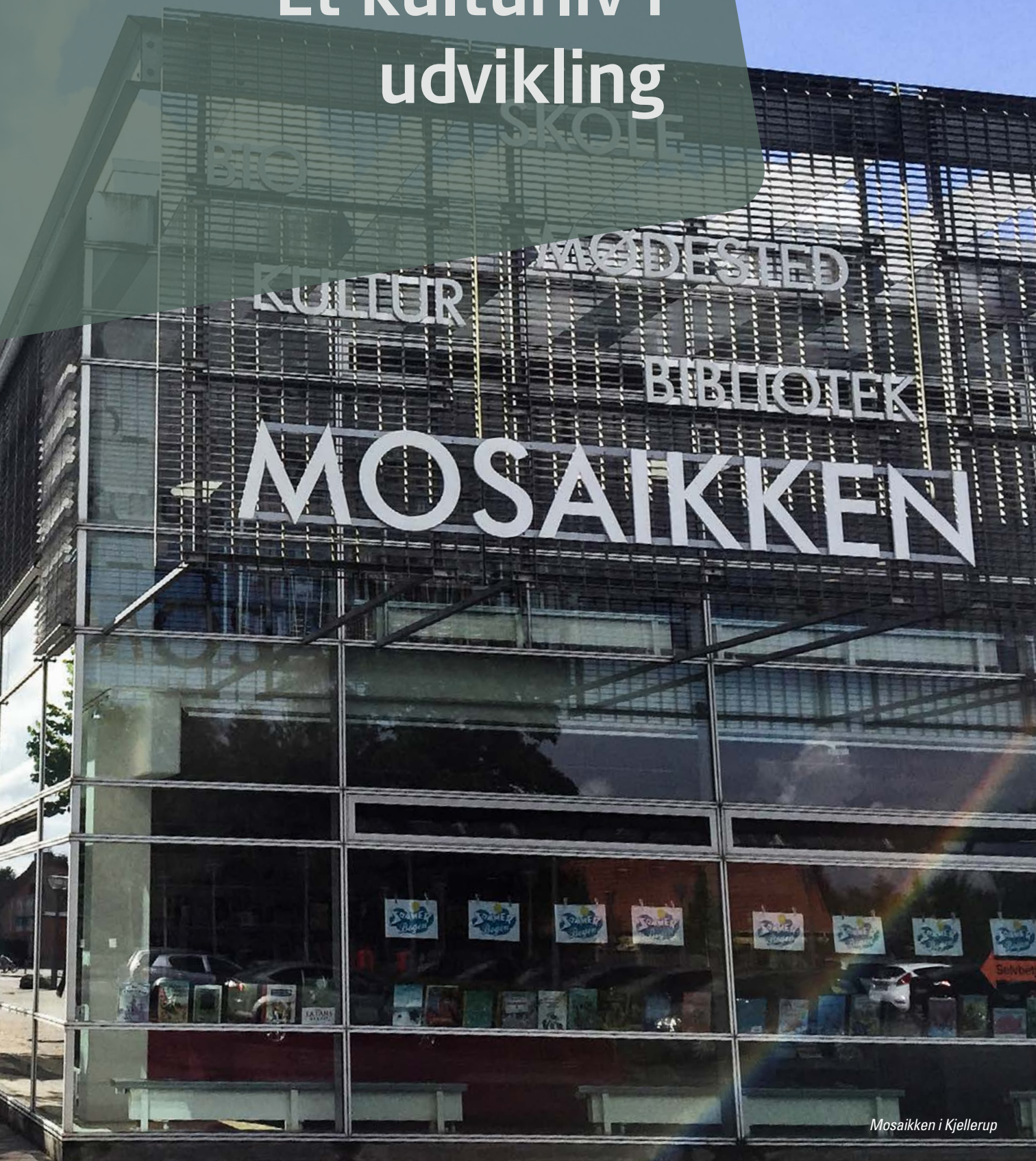
Mosaikken i Kjellerup