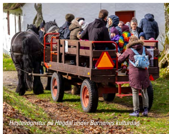
Hestevognstur på Høgdal under Børnenes kulturdag.

Statens Kunstfond ønsker at fremme kunsten i Danmark blandt andet ved at tilgodese formidling af kunst over for børn og unge. Huskunstnerordningen under Statens Kunstfond har til formål at fremme børn og unges møde med professionel kunst i dagligdagen ved at skoler og andre institutioner i en periode kan få tilknyttet professionelle kunstnere inden for et eller flere kunstområder under Statens Kunstfond. Formålet med ordningen er, at børn og unge i alderen 0 til 19 år får indblik i og erfaring med kunstneriske processer gennem et møde med en professionel, aktiv kunstner. Silkeborg Kommune og børne- og læringsinstitutionerne her gør kun i meget begrænset omfang brug af Statens Kunstfonds huskunstnerordning. Det er ambitionen at Silkeborg Kommune i højere grad skal gøre brug af Statens Kunstfonds Huskunstnerordning.