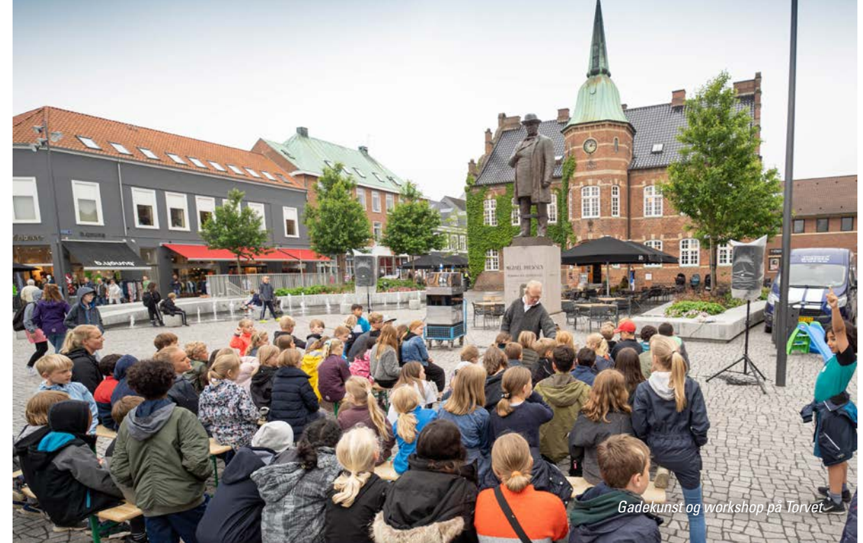
Gadekunst og workshop på Torvet