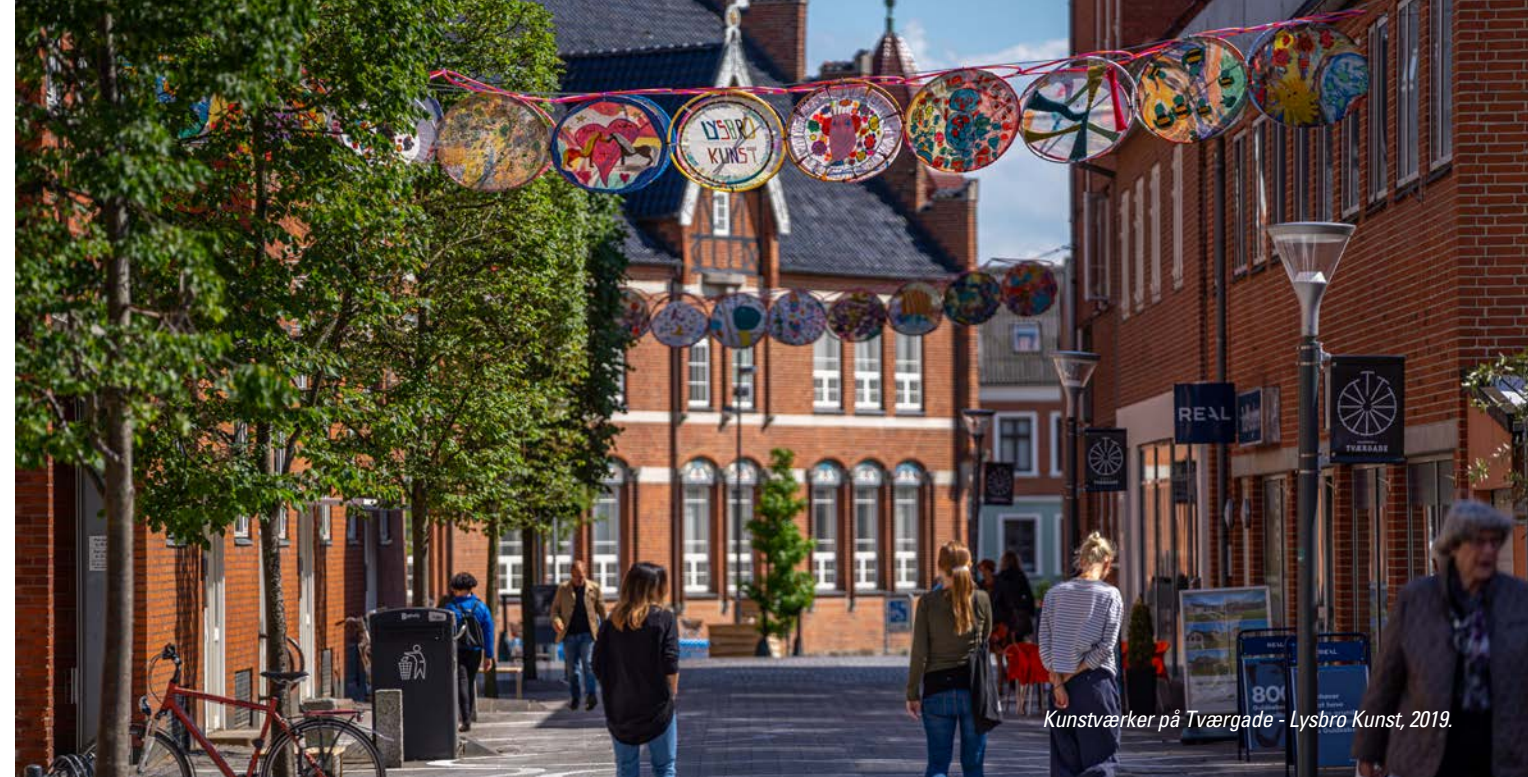
Kunstværker på Tværgade - Lysbro Kunst, 2019.

Midlertidige byrumsprojekter kan fungere som en driver i byudviklingen. Vi har værdifulde erfaringer fra indsatsen Levende Byrum under Kulturaftale Østjysk Vækstbånd og fra Urban Lab.