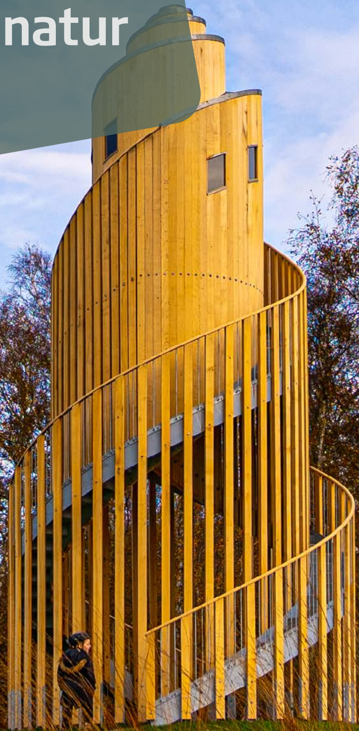
Samtaletårnet ved Silkeborg Højskole - af kunstner Peter Callesen