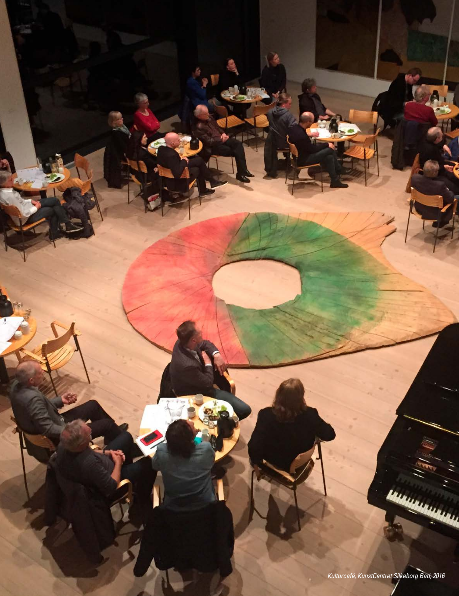
Kulturcafé, KunstCentret Silkeborg Bad, 2016