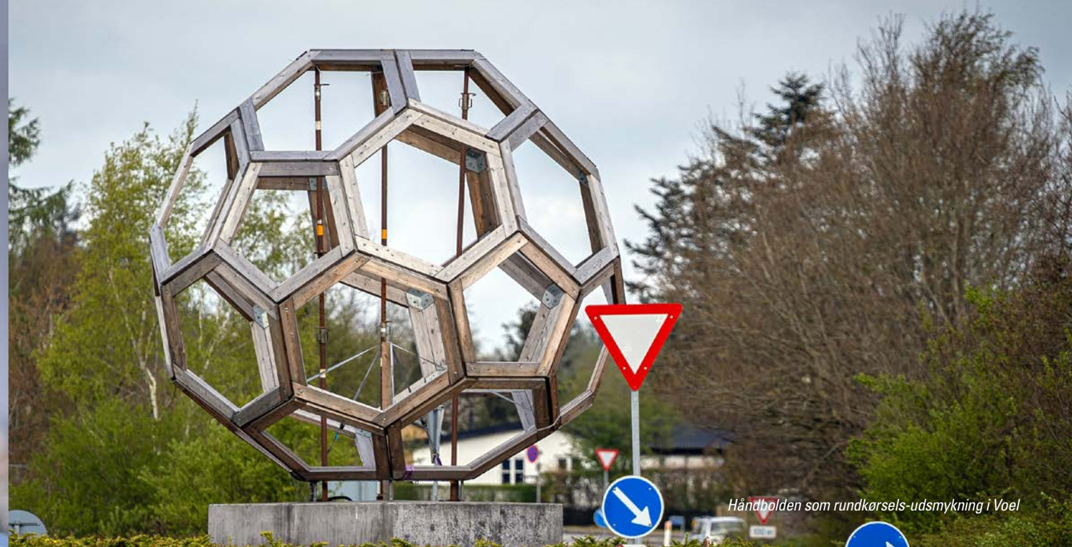
Håndbolden som rundkørsels-udsmykning i Voel